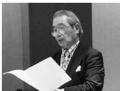
懇親会 於：南国酒家