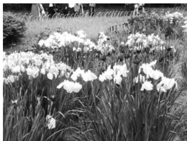
明治神宮御苑 花菖蒲

菖蒲田は「清正井」から湧き出た清ら かな水によって潤います。毎年、多く の人を楽しませてくれます。