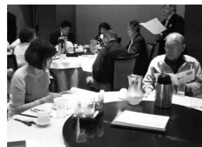
懇親会 於：南国酒家

明治神宮散策の後、歓談の場を設けま した。各々が楽しいひと時を持たれた ことと思います。