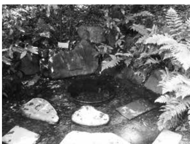
明治神宮御苑 清正井（きよまさのいど）

「清正井」（きよまさのいど）を主な水 源とする緑に囲まれた「南地」（なんち） 「御釣台」から睡蓮を眺めました。